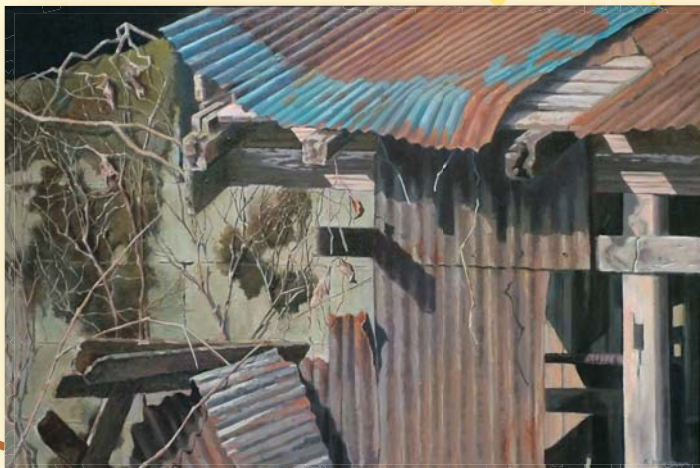
第57回市展大賞【絵画部門】