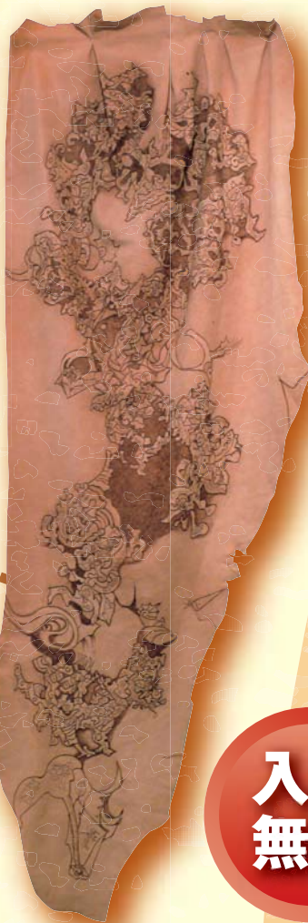
第57回市展大賞【彫刻・工芸部門】