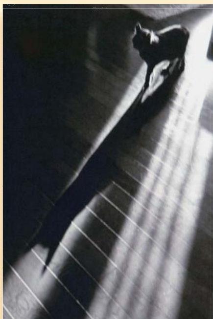
第57回市展大賞【写真部門】